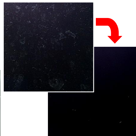
水滴跡 ⇒ 付着しにくい、取れやすい