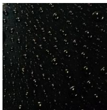
少量の水 ⇒ 水玉状